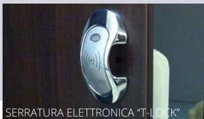
SERRATURA ELETTRONICA "T-LOCK"