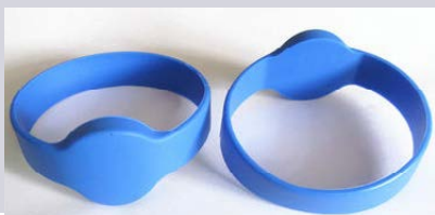
BRACCIALI A TRASPONDER